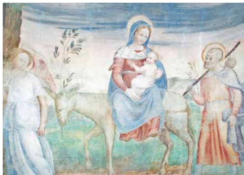
■ “La fuga in Egitto”: affresco in Santa Maria Nova

Non so se lo sapete. Io in quella grotta di presepe non ci sono arrivato per caso. No, no, mi hanno chiamato Maria e Giuseppe, dietro il comando esplicito dell'An-