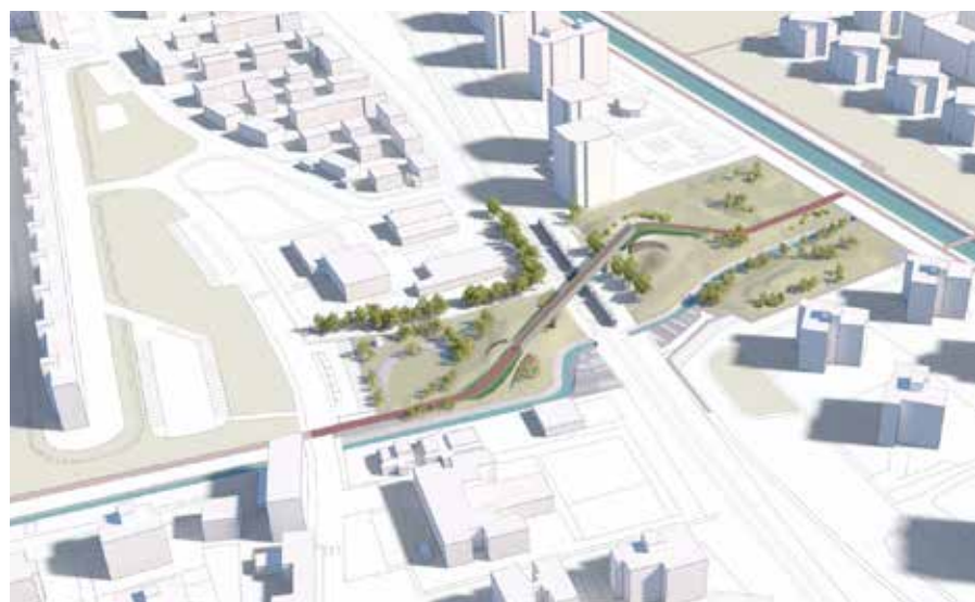
"Il ponte che attraverserà la linea della metropolitana"