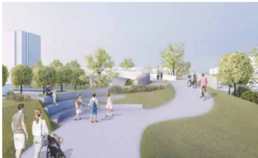
Una rete ciclabile che conetterà i quartieri di Vimodrone, proiettando anche verso l'esterno

I fulcro degli interventi viabilistici previsti è sicuramente quello sulla strada Padana, destinata a trasformarsi in un'arteria urbana nei prossimi anni, riducendo la frattura che al momento rappresenta per il Comune. Per fare questo è necessario mettere in sicurezza una strada che al momento occupa tristemente il primo posto, tra quelle del comune, per numero di incidenti. L'obiettivo principale sarà delineare in modo chiaro le porzioni di strada dedicate agli automobilisti, ai pedoni e ai ciclisti. Le corsie di marcia saranno di 3,5 metri ciascuna, divise da una separazione a raso di 1,5 metri, che si alzerà in prossimità dei punti di