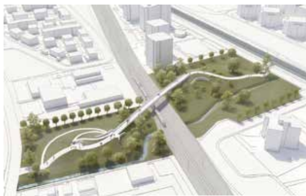
Un ponte per una connessione tra il tratto urbano e quello extraurbano

Gli aggiornamenti cercheranno dunque di spiegare e anticipare interventi che nel tempo tutti i cittadini potranno vedere e, speriamo, apprezzare.