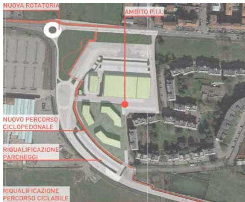
"com'era e come si presenterà l'ex idalium"