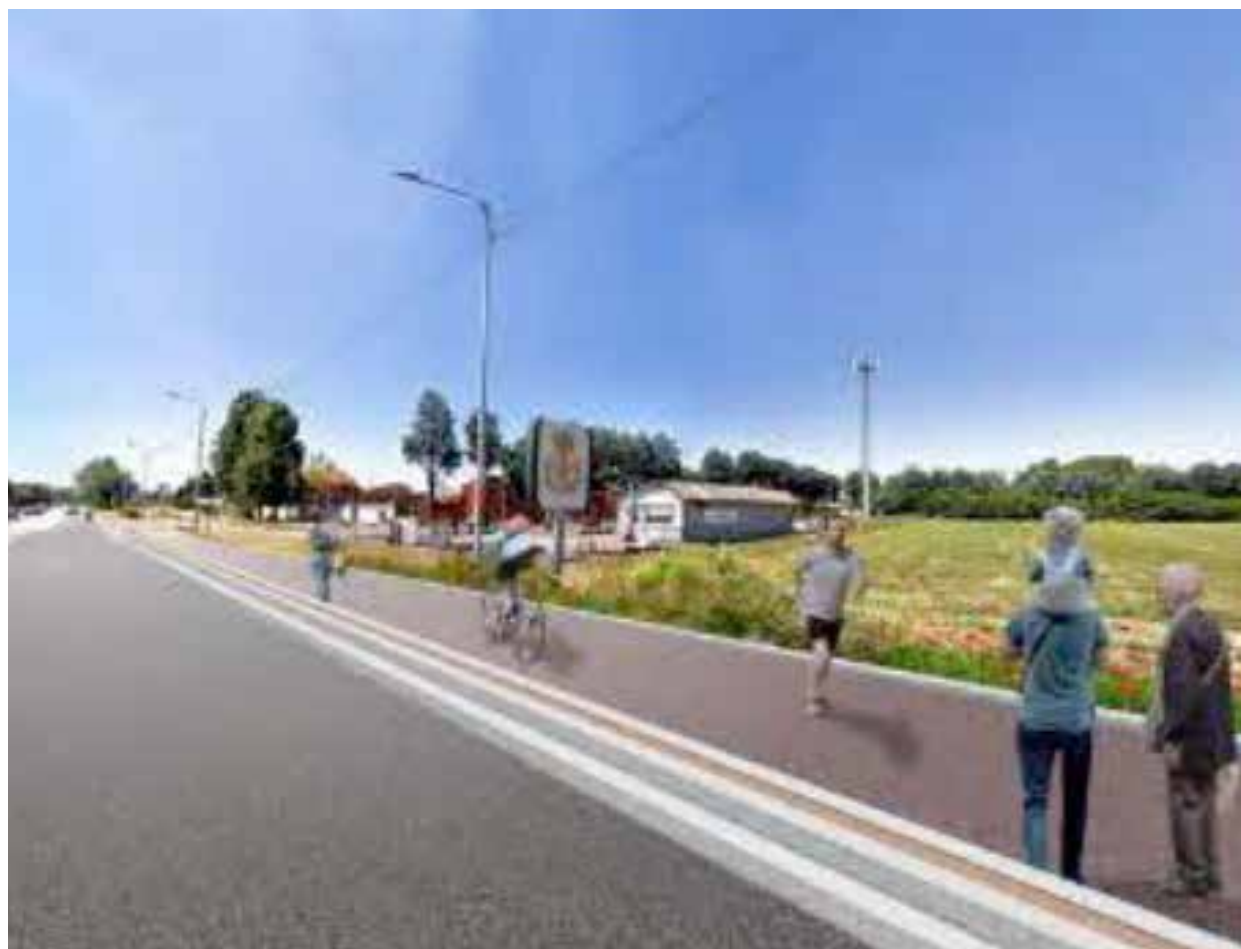
Attraversamenti pedonali sicuri e netta separazione tra spazi dedicati alle auto e quelli per ciclisti e pedoni

«Inizia a concretizzarsi un lavoro iniziato ormai più di due anni fa e che ha visto protagonista il Comando di Polizia