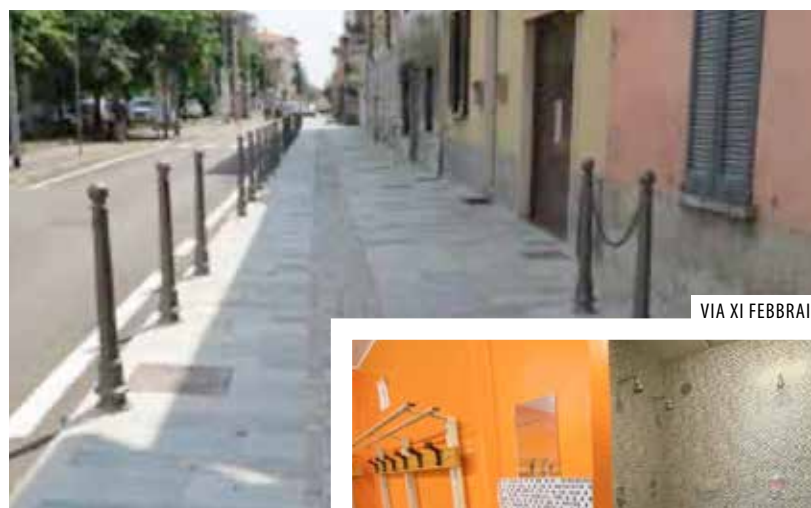
VIA XI FEBBRAIO