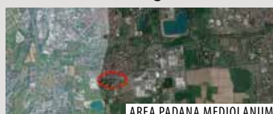
AREA PADANA MEDIO LANUM