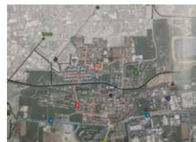
LA CONNESSIONE DELLE PISTE CICLABILI UNA VOLTA TERMINATI GLI INTERVENTI URBANISTICI