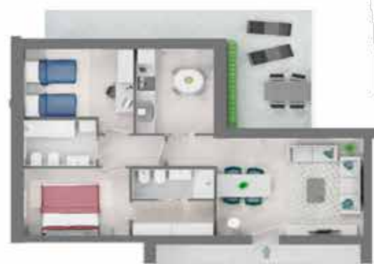
TRILOCALE Appartamento A2.1