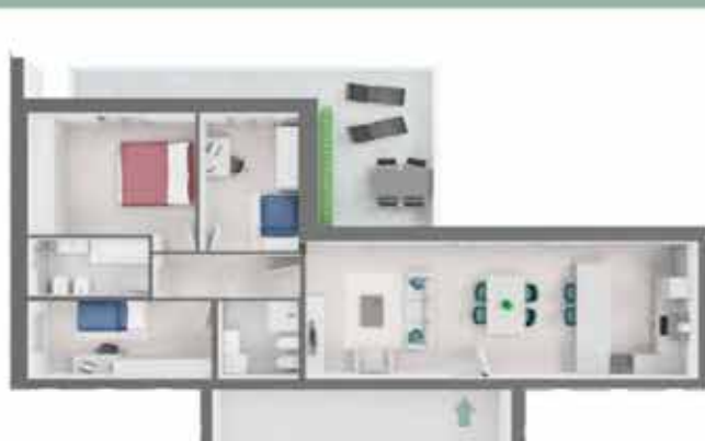
QUADRILOCALE Appartamento B2.4

NUOVA COSTRUZIONE · PROSSIMA REALIZZAZIONE VIA XXV APRILE · VIMODRONE