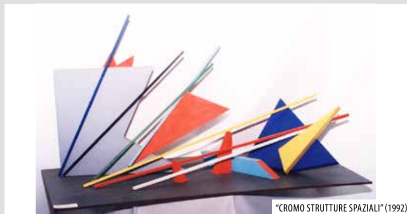
"CROMO STRUTTURE SPAZIALI" (1992)