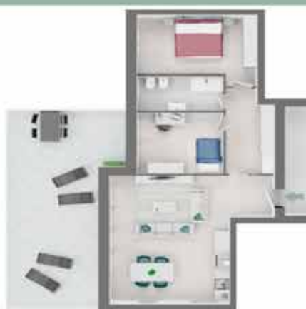
TRILOCALE Appartamento A4.3