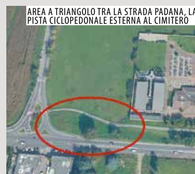
AREA A TRIANGOLO TRA LA STRADA PADANA, LA PISTA CICLOPEDONALE ESTERNA AL CIMITERO