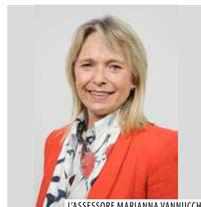
L'ASSESSORE MARIANNA VANNUCCHI

Questo ci ha permesso una gestione equilibrata delle risorse del nostro bilancio riuscendo a sostenere le maggiori necessità della popolazione vimodronese, e allo stesso garantendo la possibilità di affrontare il nuovo anno con una serenità finanziaria sufficiente per continua-