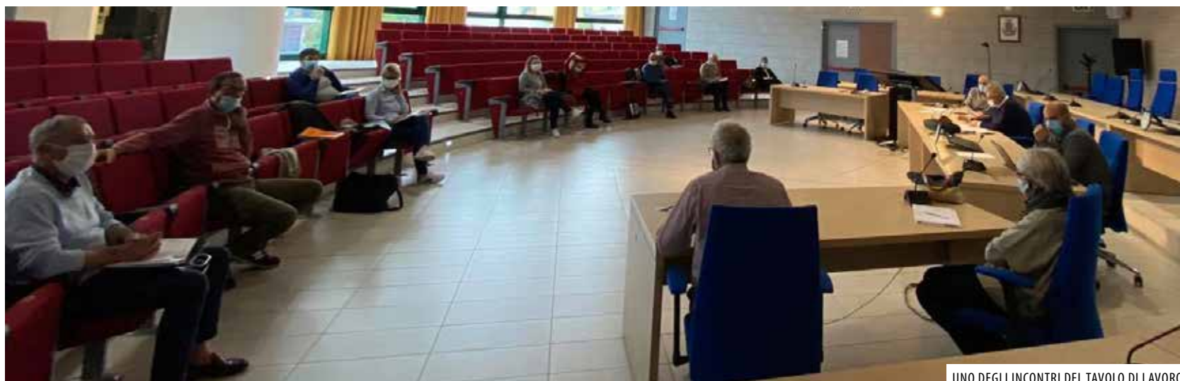
UNO DEGLI INCONTRI DEL TAVOLO DI LAVORO