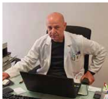
L'ASSESSORE ALLA SALUTE DOTT. ENZO GREGOLI

Come medico, ancora prima che da assessore, mi sono impegnato per aprire un centro vaccinale a Vimodrone, convinto che un ritorno alla normalità potrà avvenire solo con un grande numero di vaccini somministrati. Un polo di prossimità rimuoverà il fattore 'distanza' dalle cause di ostacolo alla vaccinazione e permetterà inoltre, grazie