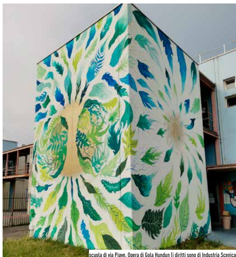
scuola di via Piave. Opera di Gola Hundun (i diritti sono di Industria Scenica)