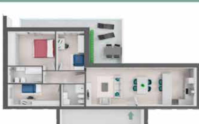
QUADRILOCALE Appartamento B2.4

NUOVA COSTRUZIONE · PROSSIMA REALIZZAZIONE VIA XXV APRILE · VIMODRONE