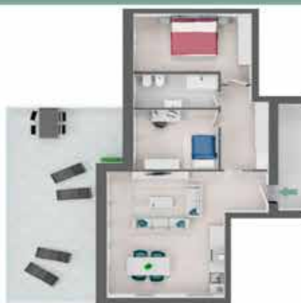
TRILOCALE Appartamento A4.3