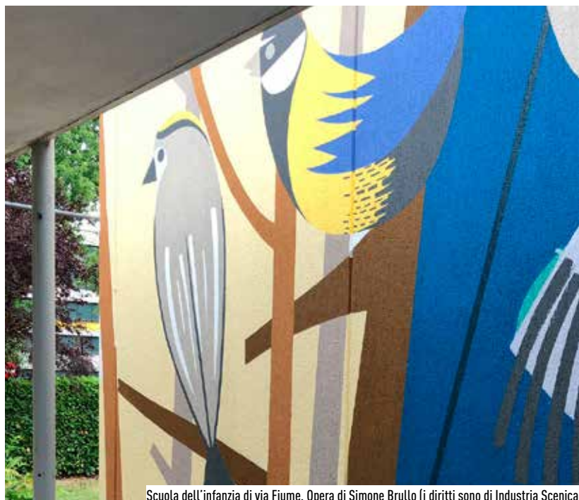
Scuola dell’infanzia di via Fiume. Opera di Simone Brullo (i diritti sono di Industria Scenica)