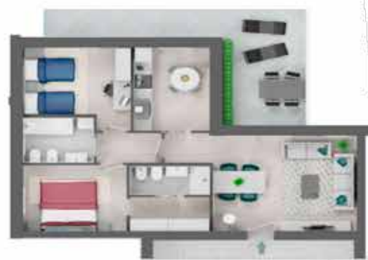
TRILOCALE Appartamento A2.1