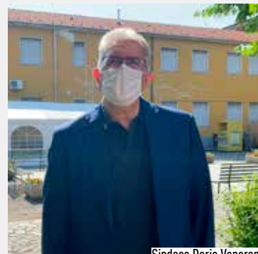
Sindaco Dario Veneroni

F inalmente siamo riusciti ad aprire il nostro centro vaccinale, finanziato e voluto dalla comunità di Vimodrone, grazie al lavoro d'insieme dell'Amministrazione comunale. Devo ringraziare in modo particolare anche la parrocchia e Don Maurizio, il quale ci ha concesso di utilizzare questi spazi.