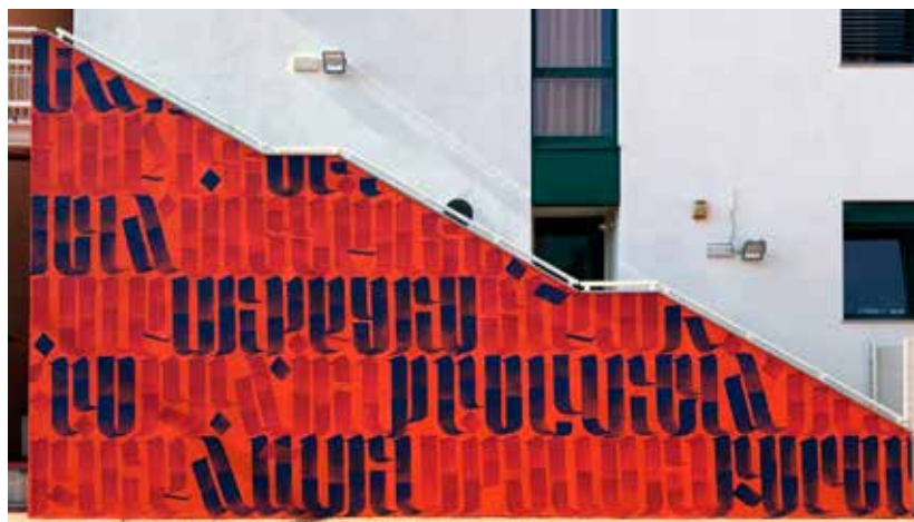
Scalinata della Biblioteca Comunale “Lea Garofalo”. Opera di Ivan Tresoldi (i diritti sono di Industria Scenica)

La nascita di ogni progetto di Industria Scenica è diversa e speciale, viene dall’incontro con persone e territori sempre diversi: ogni individuo, ogni comunità, ogni luogo è unico.