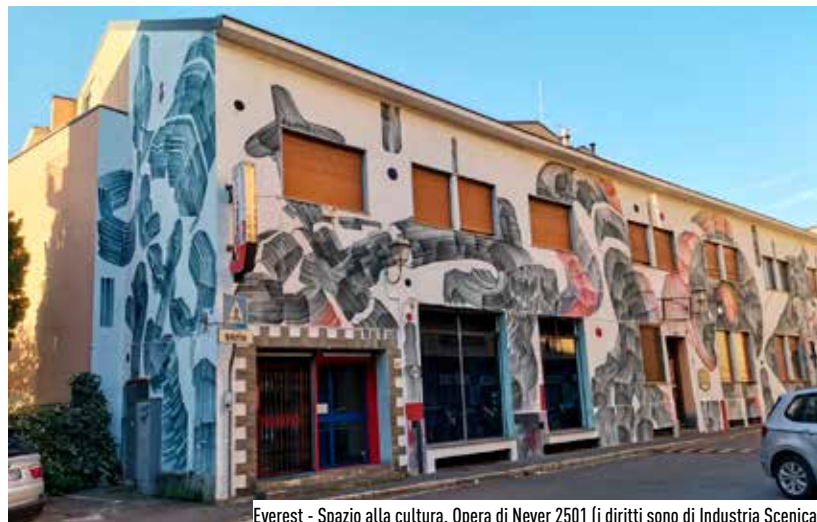
Everest - Spazio alla cultura. Opera di Never 2501 (i diritti sono di Industria Scenica)