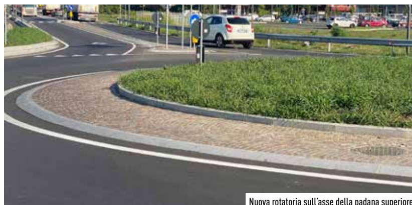
Nuova rotatoria sull'asse della padana superiore

venienti dall'adiacente zona industriale, nell'arteria di grande traffico, l'obiettivo è quello di decongestionare le strade attualmente utilizzate come via di uscita: intervento necessario anche per risolvere problemi di conflitto tra residenziale ed industriale. La realizzazione di una nuova rotatoria sull'asse della Padana Superiore, all'incrocio con via Pio La Torre, va a migliorare i collegamenti da sud senza ripassare dal centro paese. Nel breve periodo è prevista la realizzazione nell'area "De Padova" di una nuova rotatoria avente sia la funzione di svincolo, che di una nuova connessione, in direzione sud, con la zona destinata alle attività economiche che è complementare alla riorganizzazione della viabilità nella zona industriale.