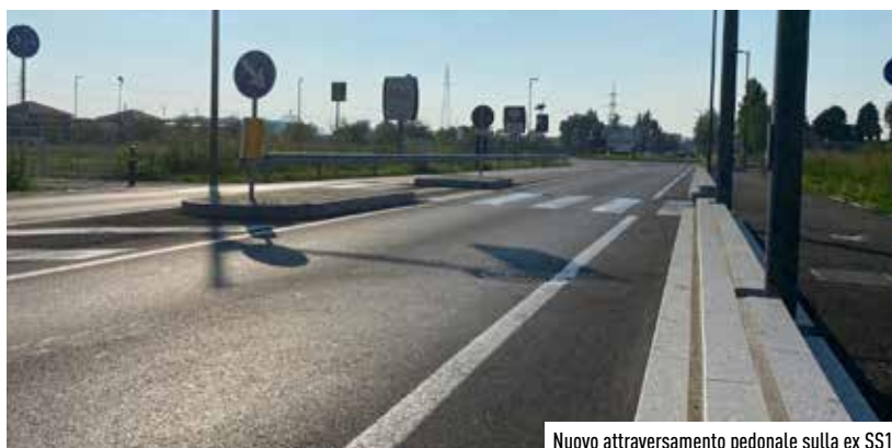
Nuovo attraversamento pedonale sulla ex SS11