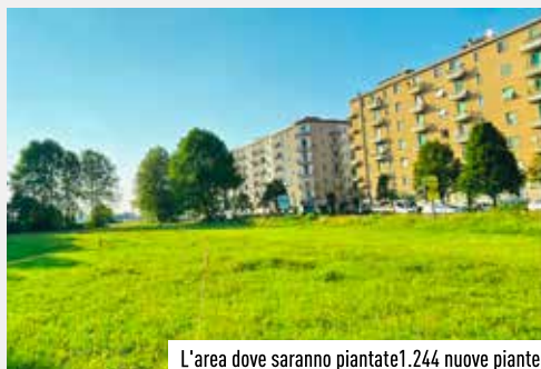
L'area dove saranno piantate 1.244 nuove piante

10.000 mq. posta tra il quartiere Mediolanum e la Strada Padana Superiore. Un intervento che vedrà la messa a dimora di 1.244 nuove piante autoctone e siepi a tre filari, per dare vita a un sistema di corridoi ecologici in grado di garantire la riduzione dell'inquinamento proveniente dal traffico della padana. La nuova area sarà fruibile dai vimodronesi grazie a un'alternanza di prati seminati con fiorume certificato per il gioco e lo svago, un percorso ciclopedonale e un'area cani attrezzata.