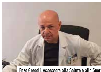
Enzo Gregoli, Assessore alla Salute e allo Sport

miglioramento generale della situazione, possiamo quindi gradualmente tornare ad abitare palestre e spazi sportivi, ma in questa fase occorre farlo con grande attenzione e senso di responsabilità e soprattutto vaccinandosi senza alcuna perplessità: è l'unico modo che abbiamo per tornare a vivere presto la nostra normalità.