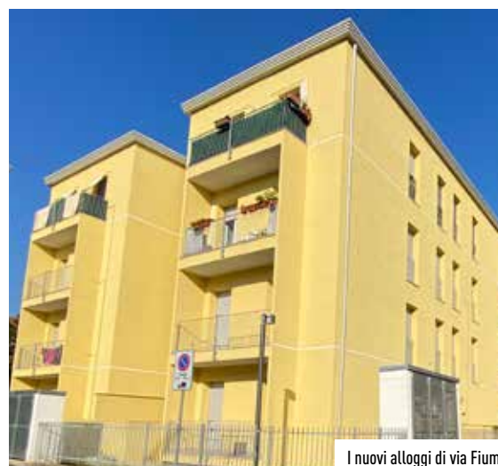
I nuovi alloggi di via Fiume

L'importante riconoscimento è arrivato dal Sindaco e dalla Vice-sindaco di Città Metropolitana Beppe Sala e Arianna Censi che sabato 19 settembre hanno voluto congratularsi con i volontari della Protezione Civile per l'impegno e la dedizione, non sconti, profusi nei loro comuni. "Dopo tanta sofferenza,