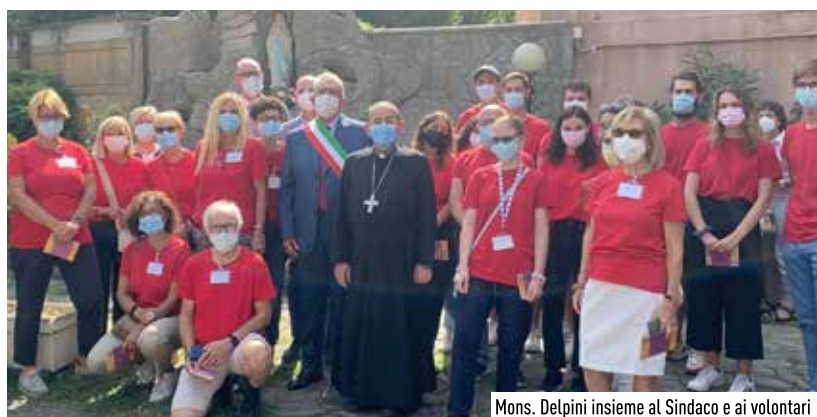
Mons. Delpini insieme al Sindaco e ai volontari

L'arcivescovo di Milano Mario Delpini in visita al centro vaccinale di Vimodrone