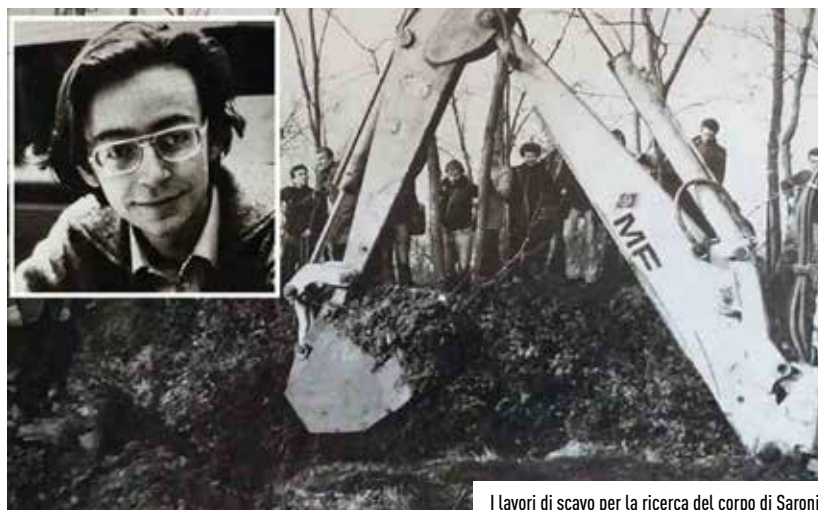
I lavori di scavo per la ricerca del corpo di Saronio

accertato anni dopo, ma il corpo fu ritrovato solo dopo tre anni e mezzo, a seguito della tardiva confessione del capo della banda che eseguì il rapimento, il già citato Casirati. Insieme a lui al processo venne condannato in primo grado a 27 anni di reclusione, poi ridotti in appello a 10 anni in ragione della sua collaborazione e della nuova legge sui pentiti, l'ideatore del rapimento Carlo Fioroni, un esponente milanese fuoriuscito da poco da Potere Operaio e passato in clandestinità pochi mesi prima dell'arresto. Perché ritornare su questa vicenda avvenuta sullo sfondo della seconda parte degli anni '70, i cosiddetti "anni di piombo"? In primis in ragione del tragico epilogo consumatosi a poche centinaia di metri dal quartiere Mediolanum "lungo la strada di campagna che da Vimodrone porta a Rovagna-