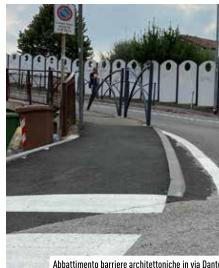
Abbattimento barriere architettoniche in via Dante