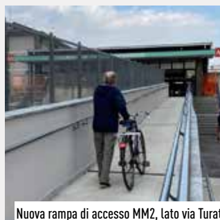
Nuova rampa di accesso MM2, lato via Turati

stazione M2 Vimodrone Centro, con la creazione di due ascensori e due rampe di accesso, sia sul lato di via Turati dove i lavori sono in fase di conclusione, sia sul parcheggio di via Dante dove invece i lavori stanno proseguendo come da programma.