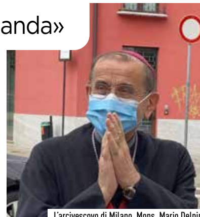
L'arcivescovo di Milano, Mons. Mario Delpini

Non sono venuto qui per insegnare qualcosa, ma per trovare una risposta a questa domanda e io trovo qui una risposta che mi incoraggia, perché siamo fatti per darci una mano, per organizzarci in intelligenza, siamo fatti per condividere la fiducia, per convergere anche se siamo diversi, anche se rappresentiamo istituzioni competenti in ambiti diversi. Io come uomo di chiesa sono venuto qui a dirvi: Dio è alleato del bene che facciamo».