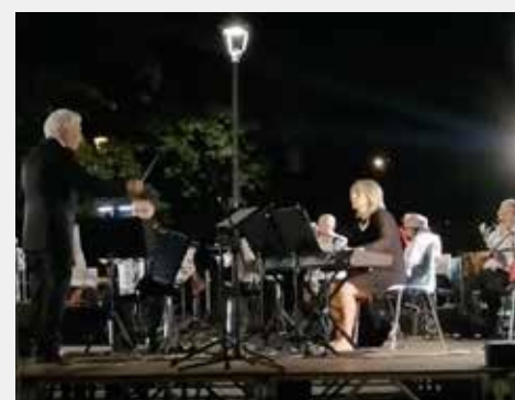
Scent of a Woman e Hello Dolly dall'omonima pellicola.

L a musica è tornata a essere protagonista per una sera, con i brani tratti da film celebri eseguiti dalla Fisorchestra Italiana, diretta dal Maestro Vincenzo Mininno. Una serata di emozioni accompagnata dalle note di brani come Por una cabeza dal film