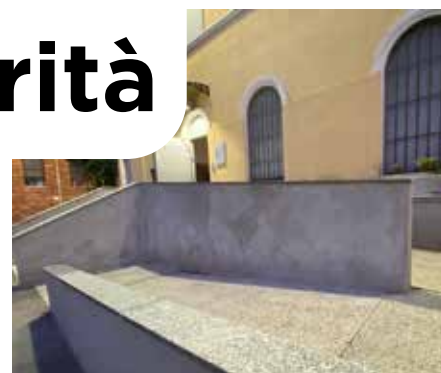
Nuova rampa di accesso alla palazzina ex-ASL

ticolare l'intervento in via Dante è stata una risposta a una situazione critica che si protraveva da anni. Sono inoltre previsti ulteriori interventi di sistemazione e riqualificazione della rampa per l'accesso all'edificio comunale di via Cesare Battisti n°23.