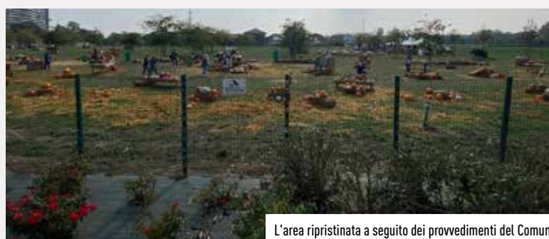
L'area ripristinata a seguito dei provvedimenti del Comune