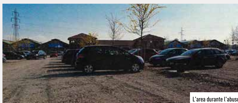
L'area durante l'abuso

Il 14 settembre 2022 vede la pronuncia anche del giudice penale che non modifica la condanna già decisa al primo grado per i reati di abuso edilizio e discarica abusiva, condannando Steflor al pagamento al Comune delle spese legali, e prendendo atto della prescrizione delle pene connesse, per decorrenza dei termini.