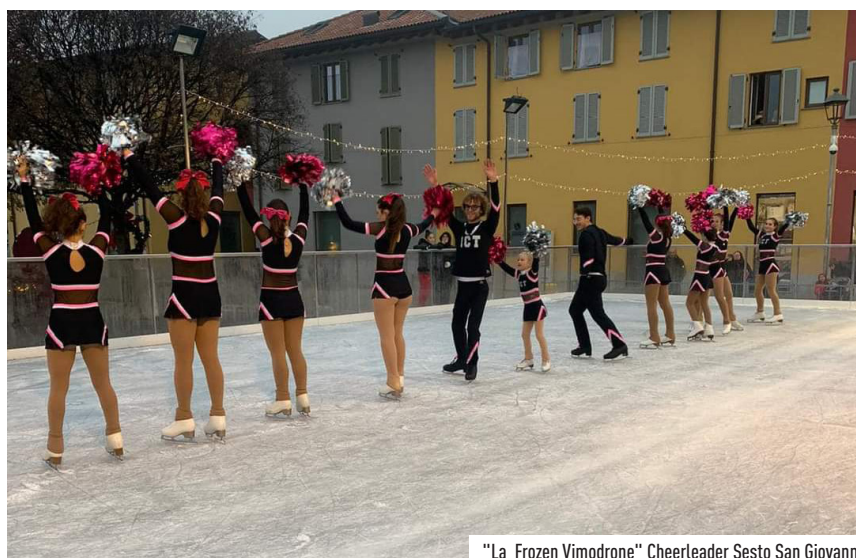
"La Frozen Vimodrone" Cheerleader Sesto San Giovanni