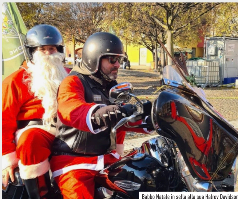
Babbo Natale in sella alla sua Harley Davidson

ne VRR. L'originale iniziativa ha visto un Babbo Natale in versione centauro fare un giro per la città, scortato dal rombo delle Harley dell'associazione vimodronese. Al termine del tour Santa Claus in persona si è dedicato a un selfie con i più piccoli in sella alla sua inedita "nuova slitta".