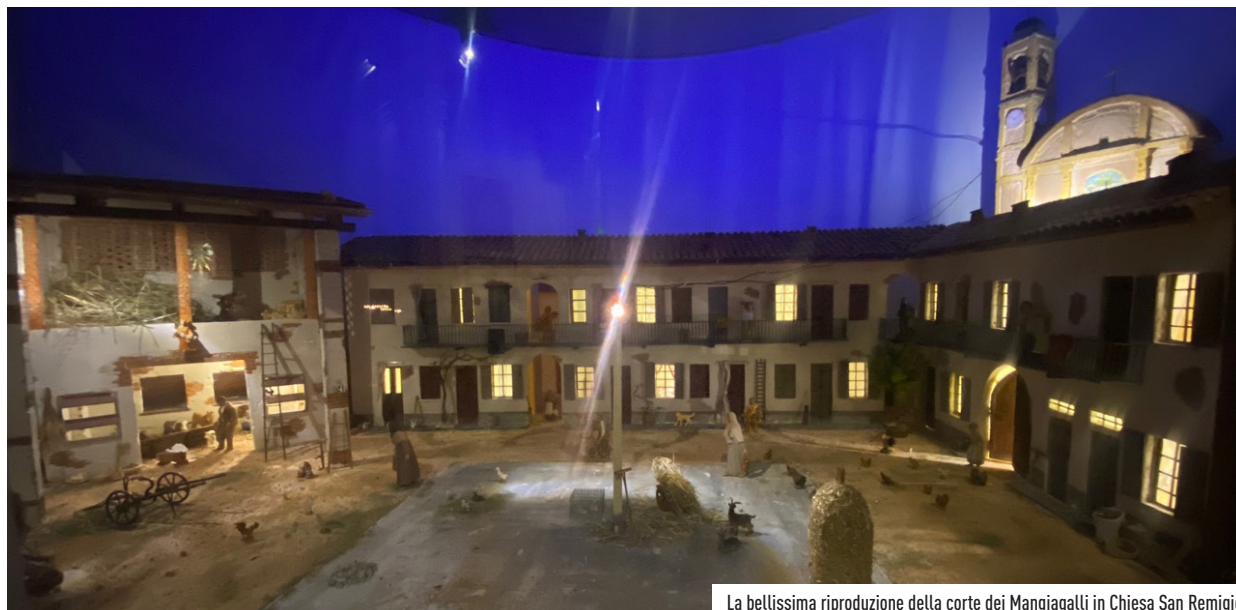
La bellissima riproduzione della corte dei Mangiagalli in Chiesa San Remigio

Uno spaccato della Vimodrone contadina agli inizi del '900, che ha riportato alla memoria di molti cittadini ricordi e storie del passato e che merita sicuramente una visita.