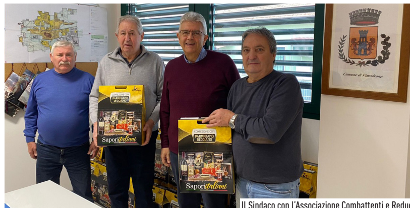
Il Sindaco con l'Associazione Combattenti e Reduci

questo periodo sta vivendo un momento di criticità. Un piccolo ma significativo gesto di attenzione a testimonianza di una comunità sempre più attenta, presente e solidale. Durante le iniziative natalizie organizzate dall'Amministrazione Comunale, sono stati inoltre allestiti i mercatini natalizi solidali, a cura del Gruppo di Acquisto Solidale Popolare e del Gruppo Vimodrone ama Vimodrone, il cui ricavato andrà ancora una volta a sostenere le famiglie vimodronesi più fragili.