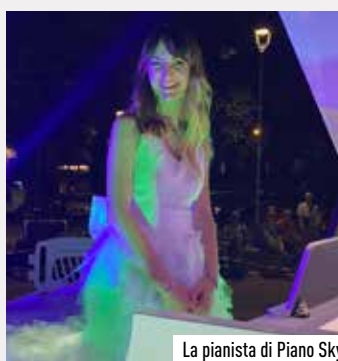
La pianista di Piano Sky