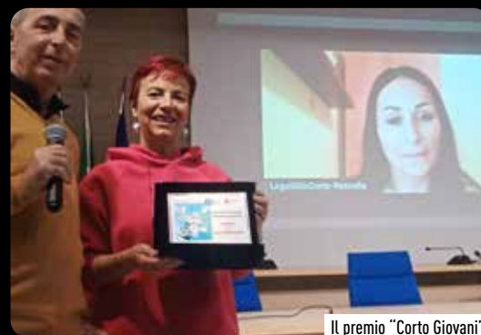
Il premio “Corto Giovani”