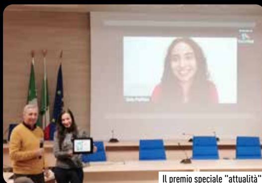
Il premio speciale “attualità”