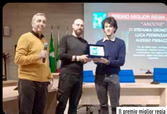
Il premio miglior regia