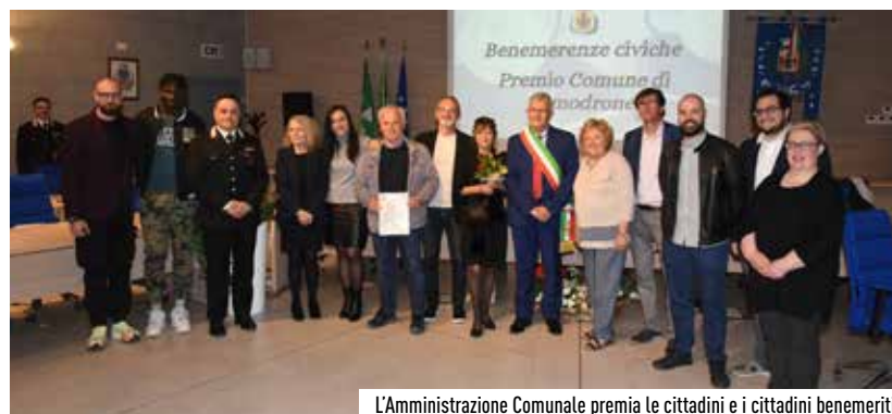
L'Amministrazione Comunale premia le cittadini e i cittadini benemeriti

Per la presenza in maniera costante sul territorio di Vimodrone dal 1990, proponendo iniziative di carattere sociale e culturale in stretta collaborazione alle attività della pubblica amministrazione, promuovendo la cultura sarda nel territorio.