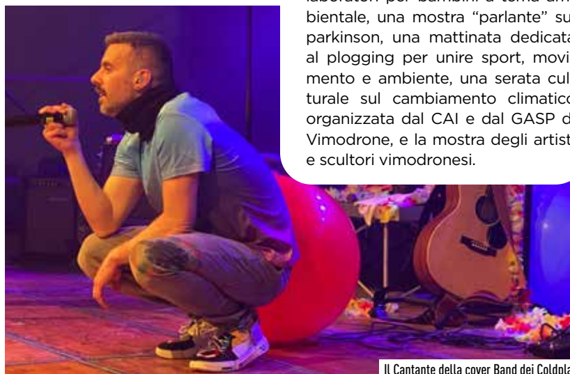
Il Cantante della cover Band dei Coldplay