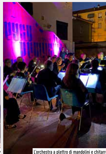
L'orchestra a plettro di mandolini e chitarre