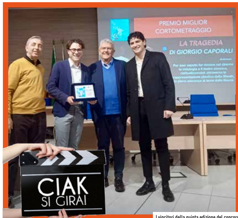
I vincitori della quinta edizione del concorso