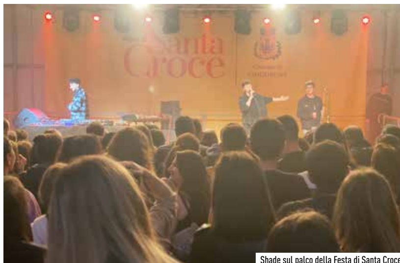
Shade sul palco della Festa di Santa Croce

Oltre la musica, tante le attività che hanno coinvolto la cittadinanza tra laboratori per bambini a tema ambientale, una mostra “parlante” sul parkinson, una mattinata dedicata al plogging per unire sport, movimento e ambiente, una serata culturale sul cambiamento climatico organizzata dal CAI e dal GASP di Vimodrone, e la mostra degli artisti e scultori vimodronesi.