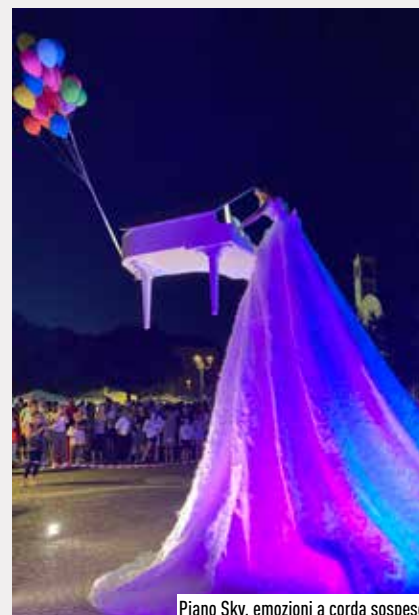
Piano Sky, emozioni a corda sospese

S pettacoli, animazioni, concerti e negozi aperti fino a tarda notte. Anche quest'anno l'appuntamento con la Notte XL è stato un successo. Migliaia di cittadini e cittadine vimodronesi, in piazza e per le vie del paese a sostegno del commercio locale per assistere a eventi, performance ed esibizioni organizzate dall'Amministrazione Comunale attraverso l'Assessorato al Commercio. Oltre a concerti e Dj set di fronte agli esercizi commerciali locali, un'insolita esibizione di "Piano Sky", ha incantato il pubblico con le note di un pianoforte suonato sospeso a 3 metri di altezza. Nel piazzale della biblioteca, l'orchestra a Plettro della Città di Milano che con chitarre e mandolini ha ripercorso le colonne sonore più famose della storia del cinema.