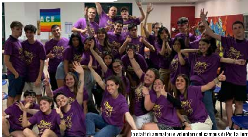
lo staff di animatori e volontari del campus di Pio La Torre

«L'organizzazione delle attività estive dedicate ai ragazzi -ha sottolineato il Vice Sindaco Marco Albertini - rappresentano per noi una priorità assoluta. E' il momento dove in assoluto, bambini e ragazzi si ritrovano ad avere maggiore tempo libero e minore presidio educativo, complice la sospensione delle attività scolastiche e genitori sempre più impegnati sul versante lavorativo. Riuscire a predisporre un progetto così articolato, differenziato e con i costi tra i più bassi della provincia di Milano