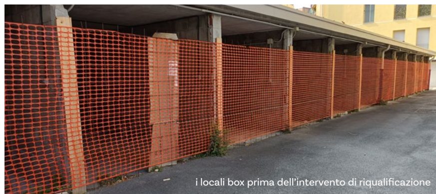
i locali box prima dell'intervento di riqualificazione