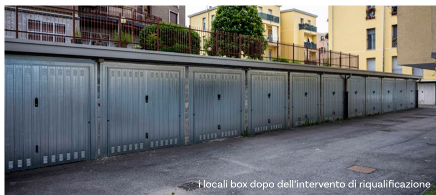
i locali box dopo dell'intervento di riqualificazione