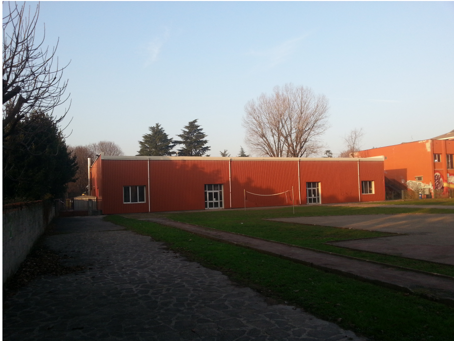
La struttura prefabbricata vista dalla scuola