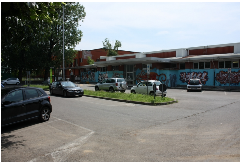
Ingresso Piscina visto da Parcheggio