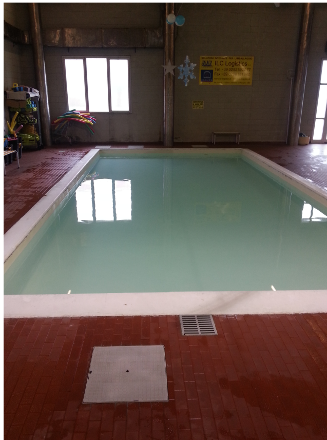
La vasca Piccola