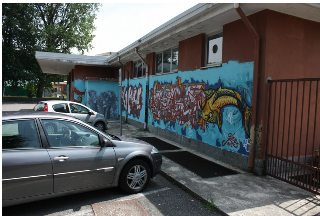
Ingresso Piscina visto da cancello lato centrale termica