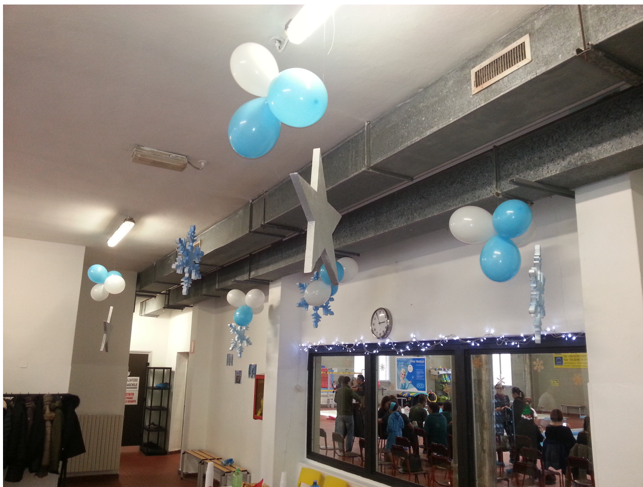
Vista interna da sala di attesa pubblico

Dove c'è la finestra interna verrà aperto il vano (tra i pilastri in c.a.) e sarà costruito il nuovo soppalco