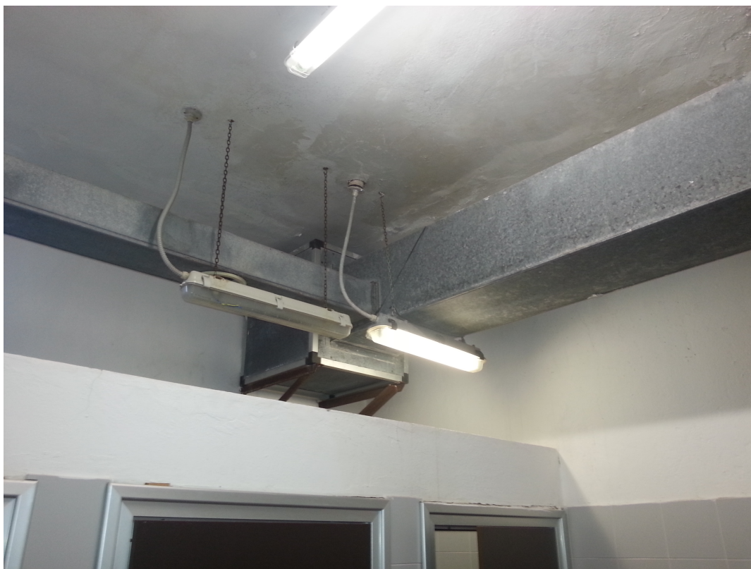
Canalizzazioni e impianti trattamento aria a soffitto