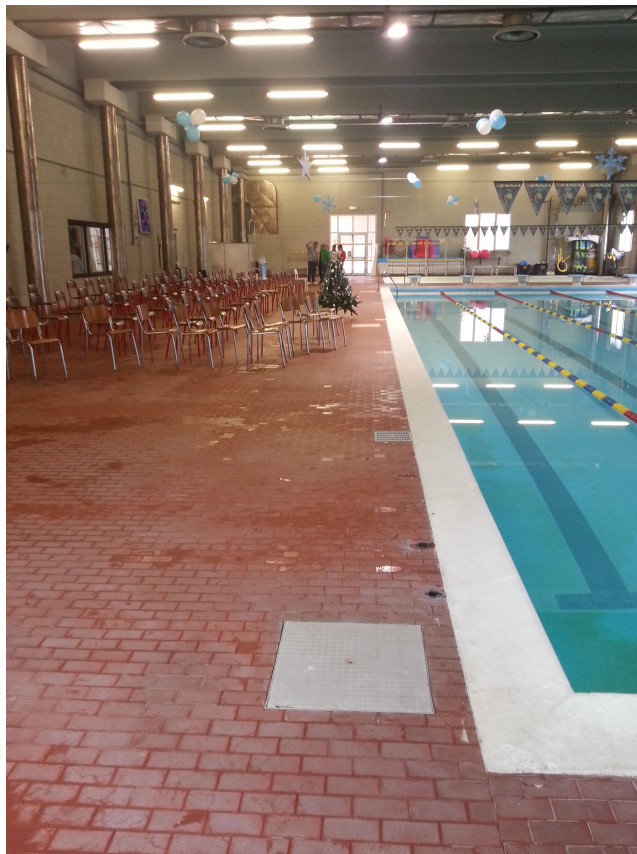
Bordo Vasca grande Esistente a sinistra il grande bordo vasca esistente