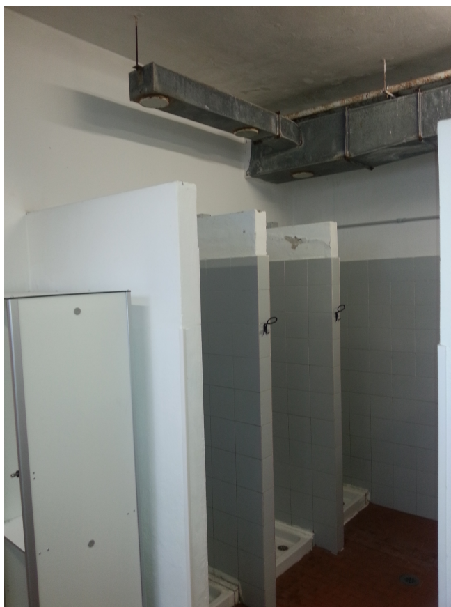
Docce in spogliatoi esistenti