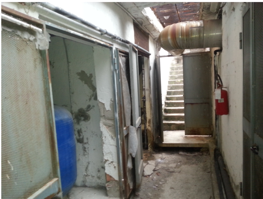
Accesso a Locali Tecnici (sinistra) e centrale termica (destra)