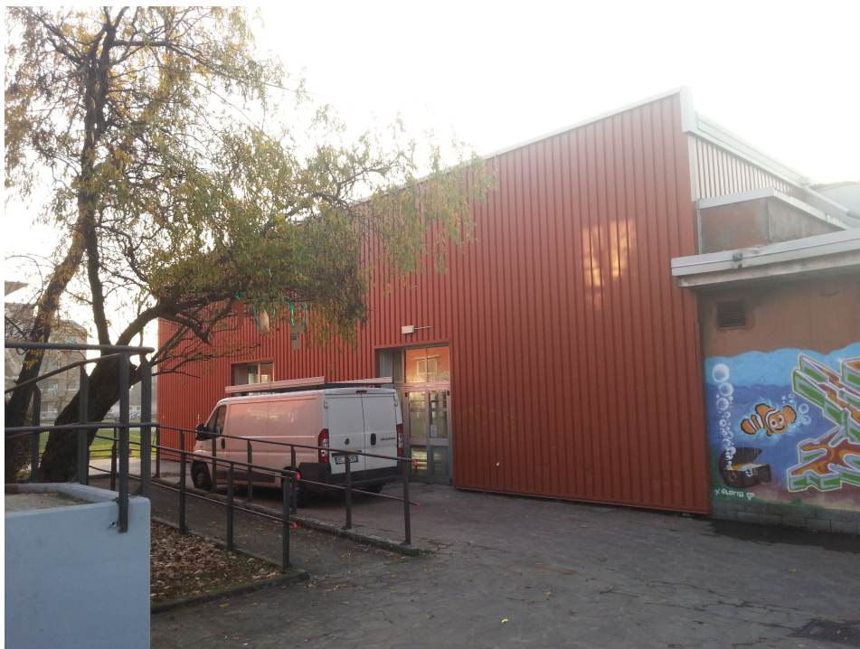
La struttura prefabbricata vista dalla scuola lato ingresso alunni